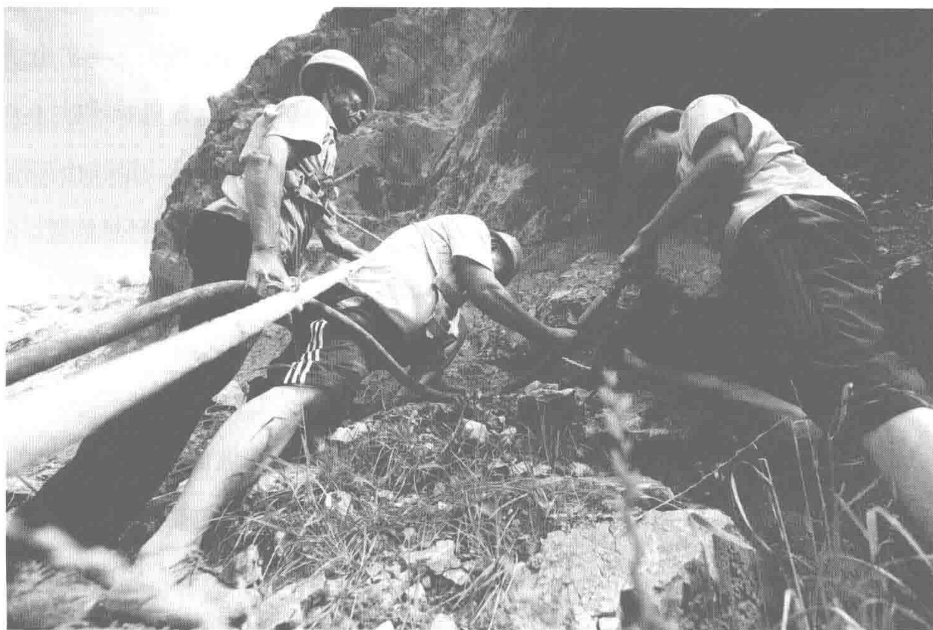
图为 2016 年 7 月，矿山修复的工作人员在栾川县城北的裸露山体植绿。