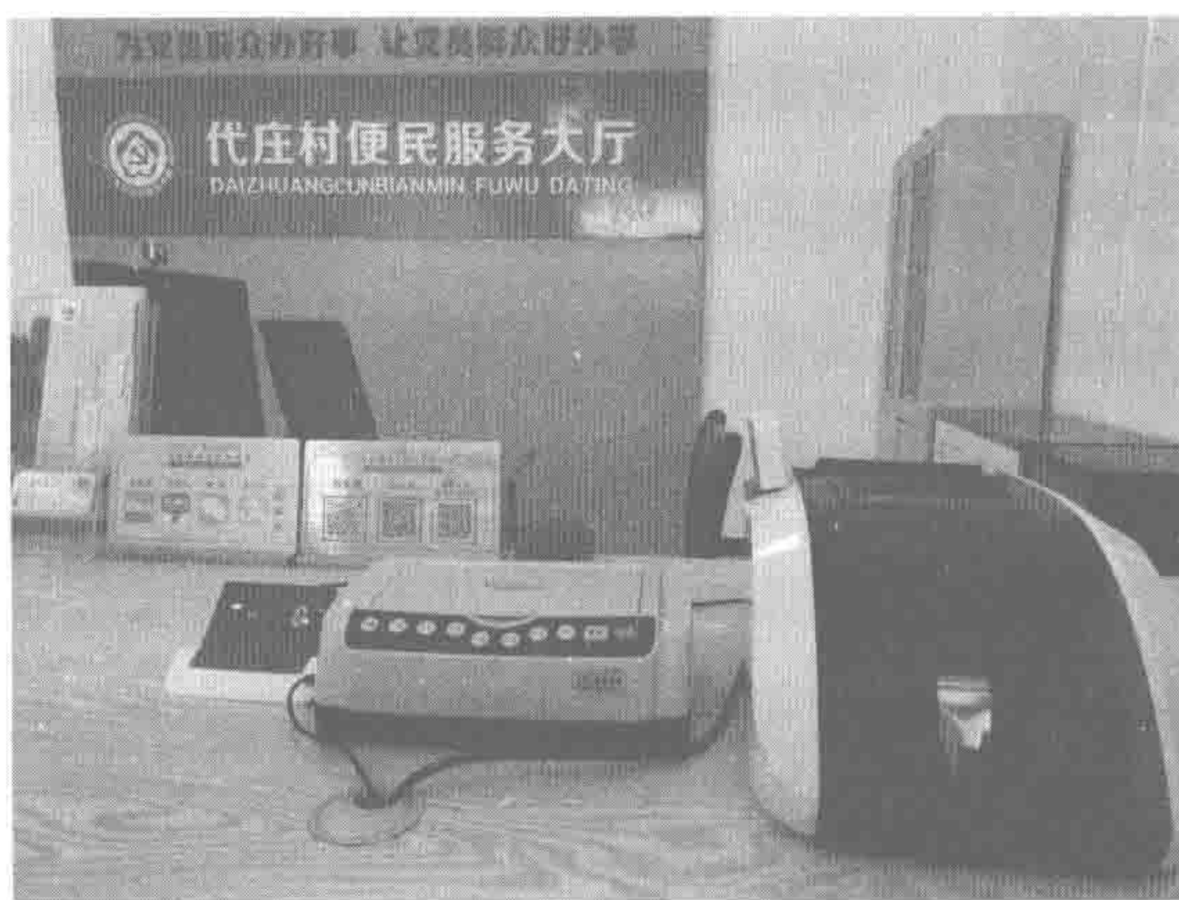
图为2019年9月，在兰考代庄村便民服务大厅，设有普惠金融服务窗口，服务当地村民，包括养老金取现服务、小额贷款咨询申报服务、网络支付咨询指导服务等。