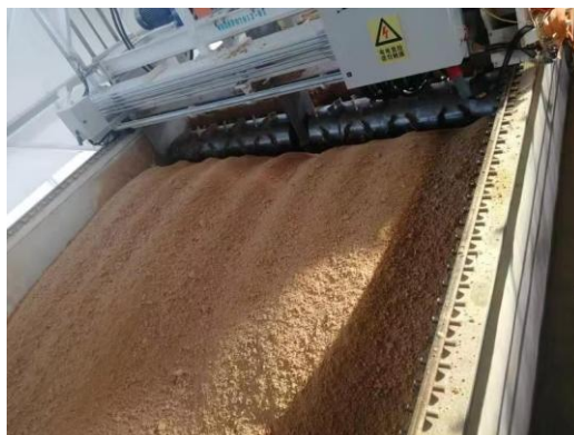
图2 发酵豆粕生产线

注：ABCDEFGH 分别代表不同的发酵工艺：A.未添加蛋白酶且同时加乳酸菌；B.未添加蛋白酶且隔夜后添加乳酸菌；C.0.5%蛋白酶同时接种乳酸菌；D.0.5%蛋白酶隔夜接种乳酸菌；E.1%蛋白酶同时接种乳酸菌；F.1%蛋白酶隔夜接种乳酸菌；G.2%蛋白酶同时接种乳酸菌；H.2%蛋白酶隔夜接种乳酸菌。